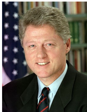
Дж. Буша старшого.

А у листопаді Біл Клінтон став президентом США, обійшовши у виборчій гонці