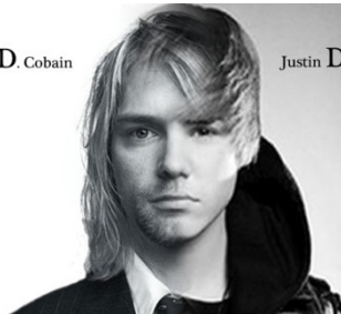
Justin D. Bieber

Отыграли свой финальный концерт в Мюнхене и прекратили своё существование «Нирвана». Причиной тому—суицид лидера группы Курта Кобейна