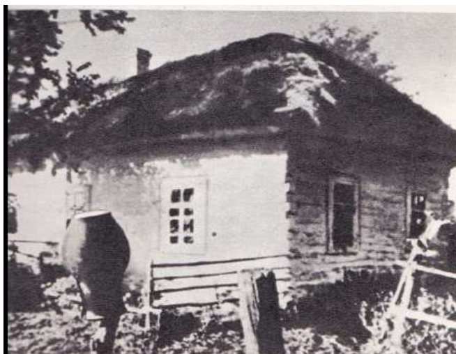
Дом, где родился А. Довженко