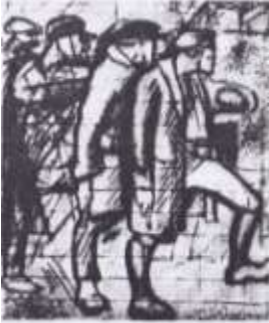
Мал. О. П. Довженка до кінофільма «Арсенал» і «Щоост».

« Приберіть тепер усі п'ятаки відних прап. Золните тільки чисте золотого правди. « Фільм «Арсенал» був великою подією в моєму житті. Я виріс у ньому як політпрацівник і порозумнішав.