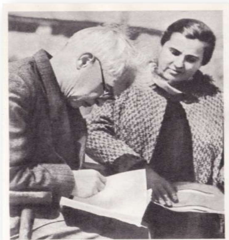
А. Довженко и Ю. Солнцева