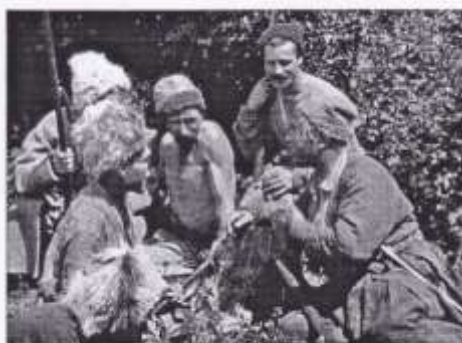
Кадр з фільму «Звенигора»