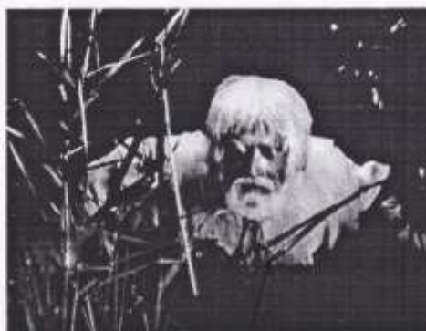
Микола Надемський – Вічний Дід