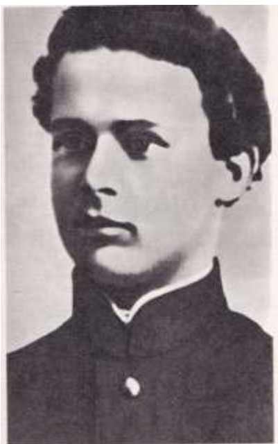
А. Довженко. 1942 г.