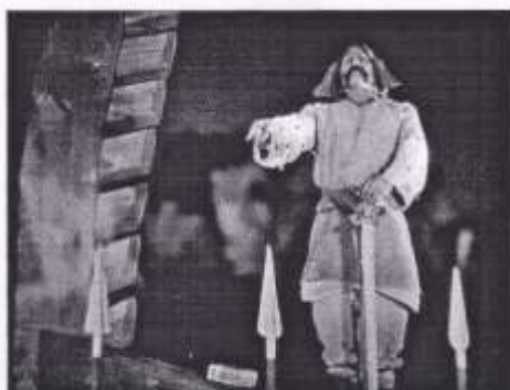
Георгій Астаф'єв – вождь скіфів